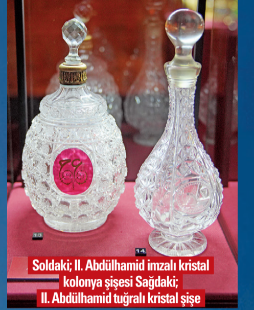
Soldaki; II. Abdülhamid imzalı kristal kolonya şişesi Sağdaki; II. Abdülhamid tuğralı kristal şişe

Osmanlı sultanlarından Abdülmecit dönemine ait tuğralı eserler, Sultan II. Abdülhamid Han'a ait kolonya şişesi, az bulunan 18. yüzyıl Kütahya gülabdanları, Avrupa kraliyet ailelerine ait sanat değeri yüksek, has altın ve fildisi parfüm şişeleri sergimizin belli başlı önemli eserleri arasında yer alıyor. Ayrıca Mustafa Kemal Atatürk'ün kullandığını bildiğimiz ve Dolmabahçe Sarayı'nda yatağının yanındayken fotoğrafı bulunan Paris Geceleri "Soir de Paris" marka şişe ve bu şişenin tüm versiyonları elimizde bulunan kıymetli eserlerden.