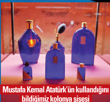
Mustafa Kemal Atatürk'ün kullandığını bildiğimiz kolonya şişesi

Yine koku kültürümüzün en değerli parçalarından 1894 yılında ilk kolonya imalathanesini kuran Ahmet Farukî'nin damıtma makinesi, tartısı ve 400 koku hammaddesinin yer aldığı koku piyanosunu da ziyaretçiler görebilecek.