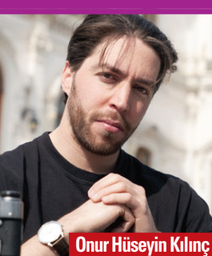
Onur Hüseyin Kılınc

Yapımcı ve yönetmenliğini Onur Hüseyin Kılınc'ın yaptığı "Tanışma Hikayeleri" programı, kültür ve sanat muhitlerinde yaşanmış unutulmaz tanışma hikâyelerini ekrana getiriyor, hafızamızı tazeliyor ve iz bırakmış şahsiyetlerin bilinmeyen yönlerini TRT 2 ekranına taşıyor. ► ALİ DEMİRTAŞ - 6'DA