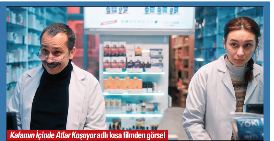
Kafamın İçinde Atlar Koşuyor adlı kısa filminden görsel